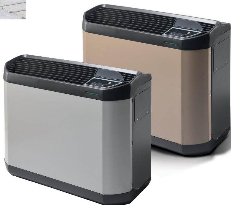
Alumínium szürke RAL 9007